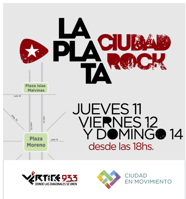
Imagen 2. Afiche «La Plata Ciudad Rock»