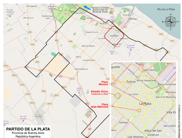
Imagen 1. Ubicación y Morfología Urbana de la Ciudad de La Plata

ciales (itinerarios, circuitos, experiencias, imaginarios) que sobrepasan la dimensión estrictamente musical del género. Teniendo en cuenta la escala de la ciudad, la actividad vinculada al rock platense es alta y la escena ha mantenido un carácter protagónico en comparación con otros lugares del país. Para el año 2008 [4] existían en la ciudad alrededor de quinientas agrupaciones musicales vinculadas a este género, se realizaban sesenta shows por semana aproximadamente y estaban disponibles alrededor de cuarenta lugares para realizar espectáculos (incluyendo bares, boliches, centros culturales, clubes, teatros, etc.). Además, fueron proliferando programas radiales, prensa especializada y festivales que ponen al rock platense en el centro de la actividad cultural de la ciudad.