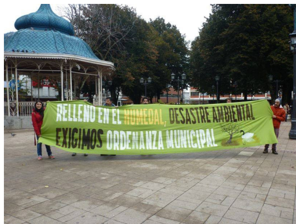
Figura 3: Manifestación para exigir una ordenanza de humedales en Valdivia.