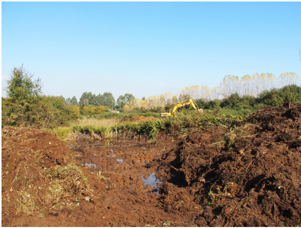
Figura 2: Destrucción de un humedal urbano en Valdivia con fines de desarrollo inmobiliario.

Basado en esta cifra, la superficie de humedales de Valdivia equivale al 37% de la superficie de la ciudad (considerando el nuevo límite urbano propuesto en la modificación al Plan Regulador Comunal, en proceso de aprobación), lo cual corrobora la importancia de estos ambientes como elementos estructurantes de la topografía urbana.